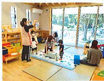
つくるの楽しいね