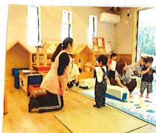
ママと一緒に おもちゃづくり