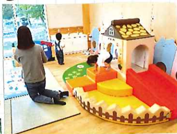
新しい室内遊具が 仲間入りしました