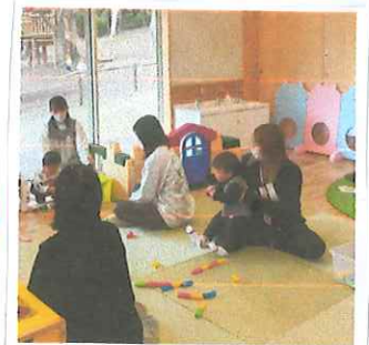
お友達やお母さん と一緒に楽しく 遊びました。