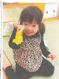
折り紙をちぎって貼り 合わせておのむしさん。 上手に出来ました。