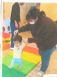
子育て 支援講座 体操教室