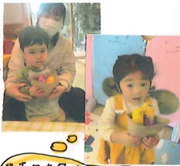
「ホクホクやさいも、 おいしく出来ました」